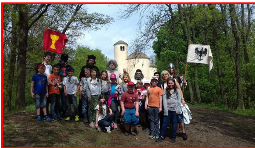
Výstup na horu Říp