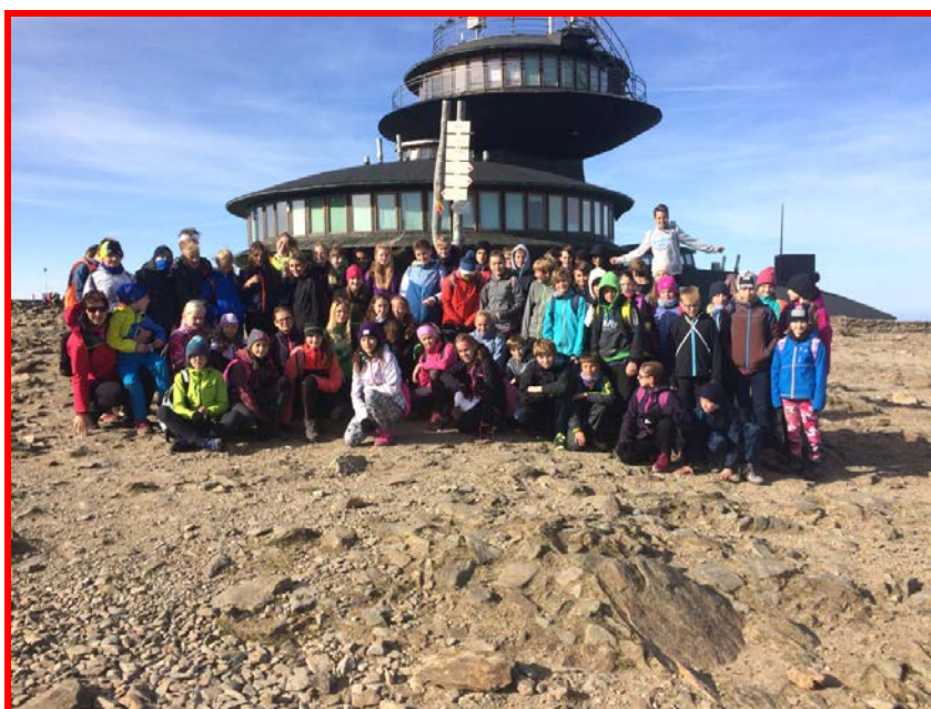
Jarní atletické soustředění

Podzimní soustředění jsou zaměřena na techniku atletických disciplin a přípravu na závodní období.