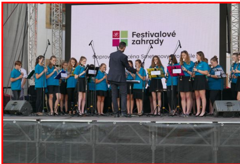
Smetanova Litomyšl/Festivalové zahrady