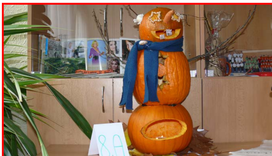
Soutěž parlamentu o nejkrásnější vyřezanou dýni

v tomto roce jsme navštívili knižní veletrh Svět knihy, nabídli jsme hádanky, křížovky, rébusy, otiskli jsme básničky a příběhy, obrázky mladších žáků, informovali jsme o akcích školního parlamentu a o mezinárodních projektech, do kterých je naše škola již několik let zapojena. Navštívili jsme také kladenskou knihovnu, byli jsme na exkurzi v České televizi a nechyběly soutěže s odměnami pro malé i velké čtenáře.