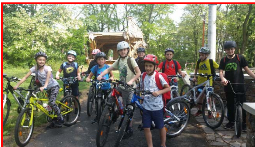
Turistický kroužek na cyklovýletě