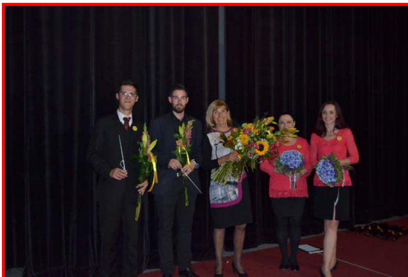
Sbormistři - výroční koncert

se do Šlovic těší a jsou na začátku školního roku motivováni do další sborové práce.