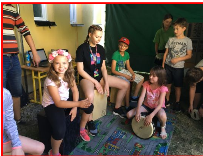
Hudební dílny na Dni hudby

Každým rokem se festival rozrůstá a letos naplnil své časové maximum, tj. výstupy probíhají průběžně od rána až do večera, za což jsme velice rádi. Již nyní máme zájemce o vystoupení na příští ročník.