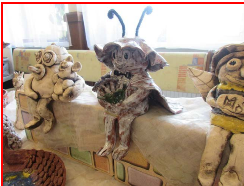
Práce keramického kroužku

Naše škola nabízí žákům i možnosti aktivního trávení volného času. Vzhledem k tomu, že žáci mají celou řadu aktivit úzce spjatých s výukou (sportovní třídy, pěvecké sbory) a budova školy je plně vytížena, je velmi obtížné najít vhodný termín i místo pro práci kroužku.