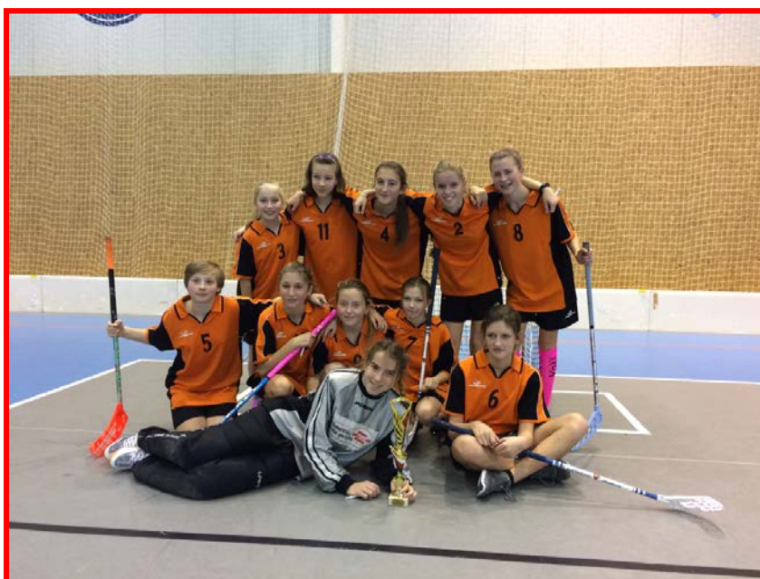
Florbalové družstvo (6. - 7. třída)