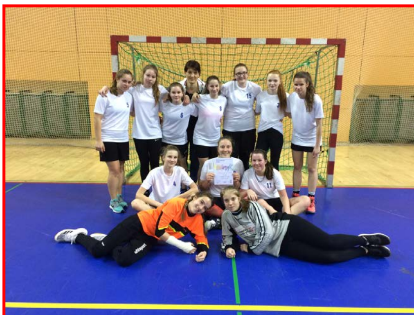
Házená - dívky (8. - 9. třída)