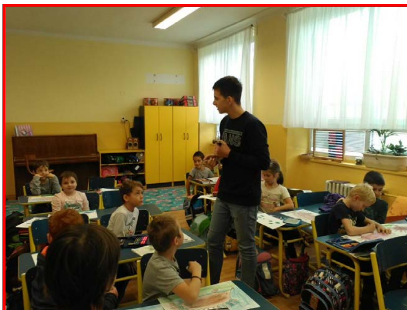
Vyprávění o terarijních zvířatech

Ve školním roce nebyla naše škola vybrána ČŠI pro testování výsledků žáků.