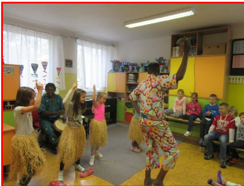
Kubánské tance ve školní družině

Celý školní rok v naší „veselé školní družině“ proběhl bez problémů a kolektiv ŠD je velmi rád, že děti jsou v našich odděleních rády a při odchodu domů přemlouvají rodiče, aby mohly zůstat déle.