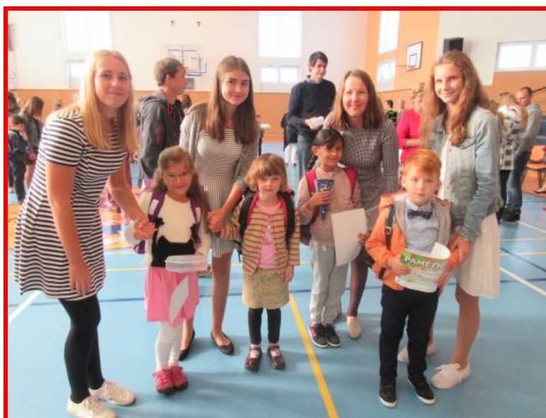
Slavnostní přivítání prvňáčků