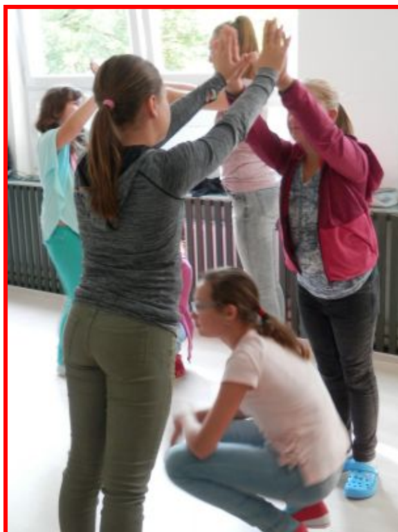
Projektový den Bezpečné klima