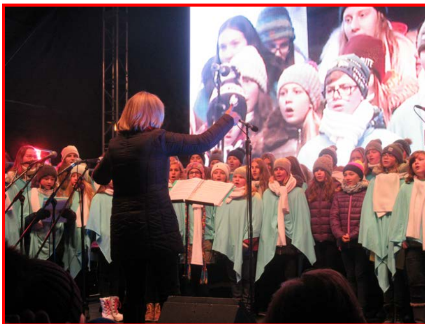
Sluníčko při rozsvěcení vánočního stromu města Kladna