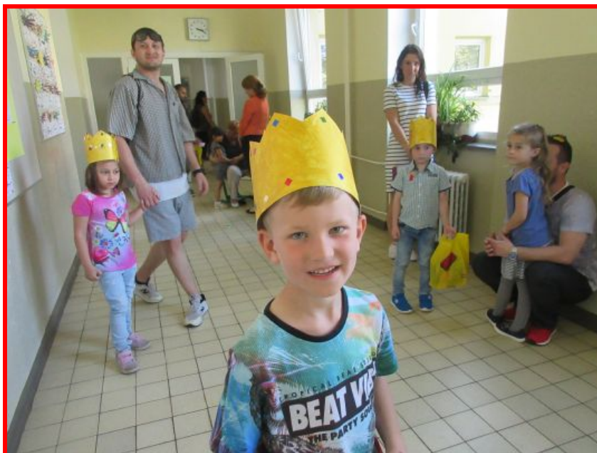
U zápisu do první třídy

K zápisu přišlo velké množství dětí (18 dětí), jejichž zákonní zástupci žádali o odklad školní docházky.