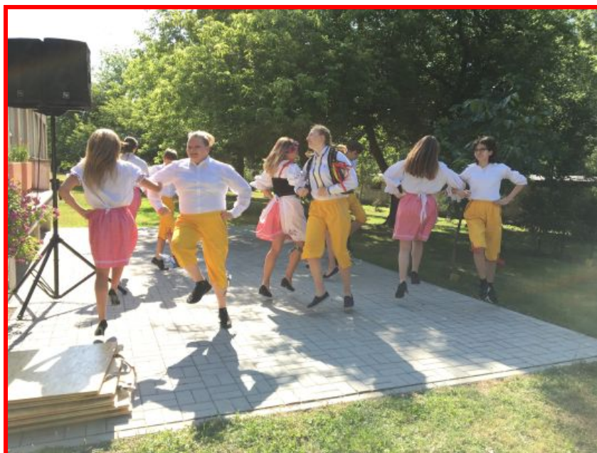
České vystoupení na Dni hudby

dále využívají nejen v hodinách cizích jazyků, ale i v rámci dalšího mezinárodního projektu „BCreActive“.