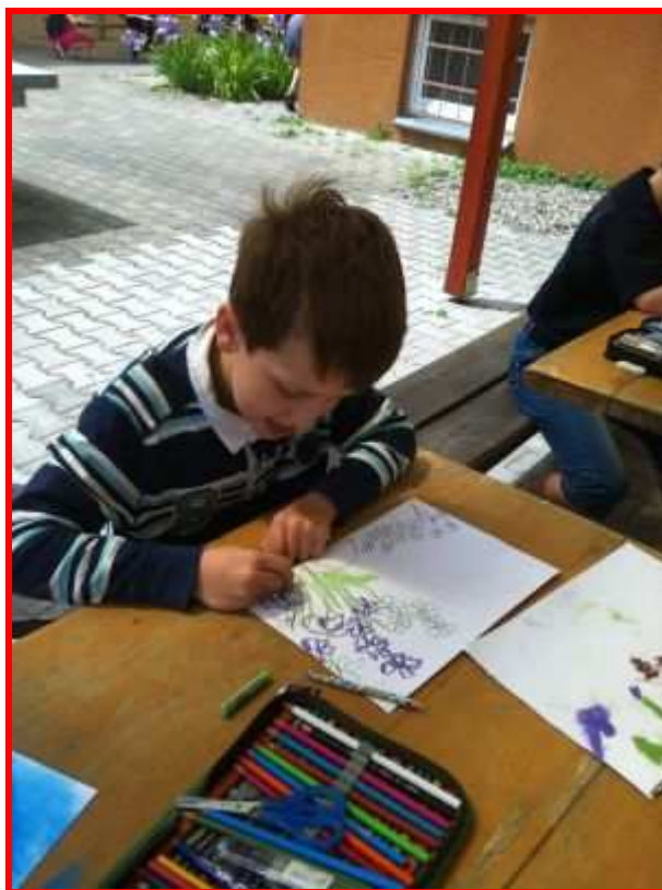
Výtvarná výchova v pergole