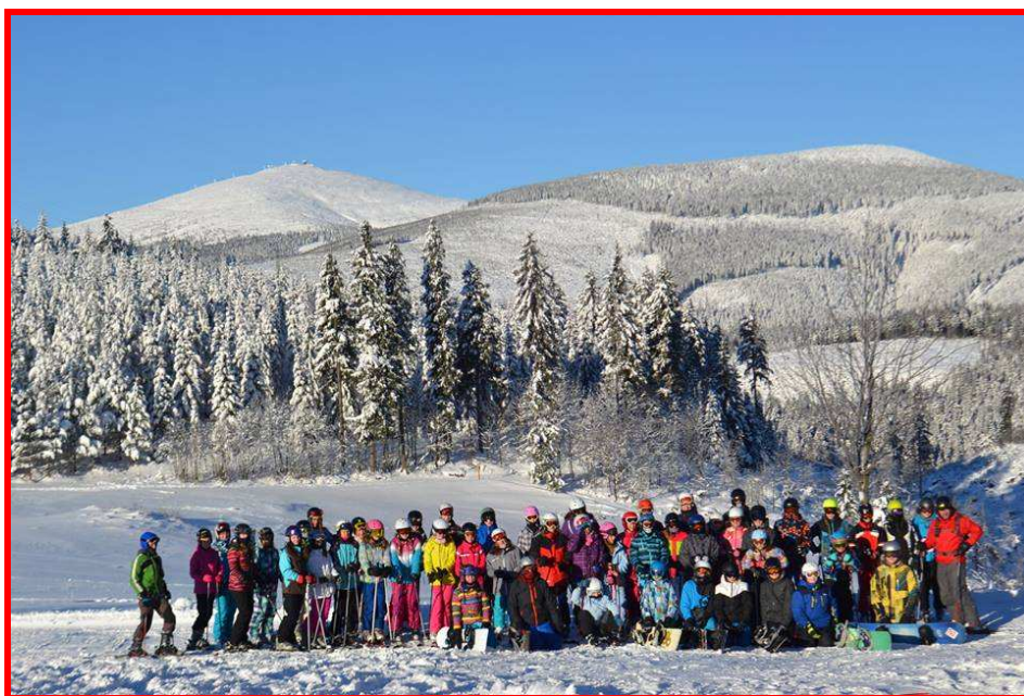
Z lyžařského kurzu 2016

Plavecký výcvik dětí prvního stupně, druhých a třetích tříd zajišťujeme ve spolupráci s plaveckou školou Medúza.