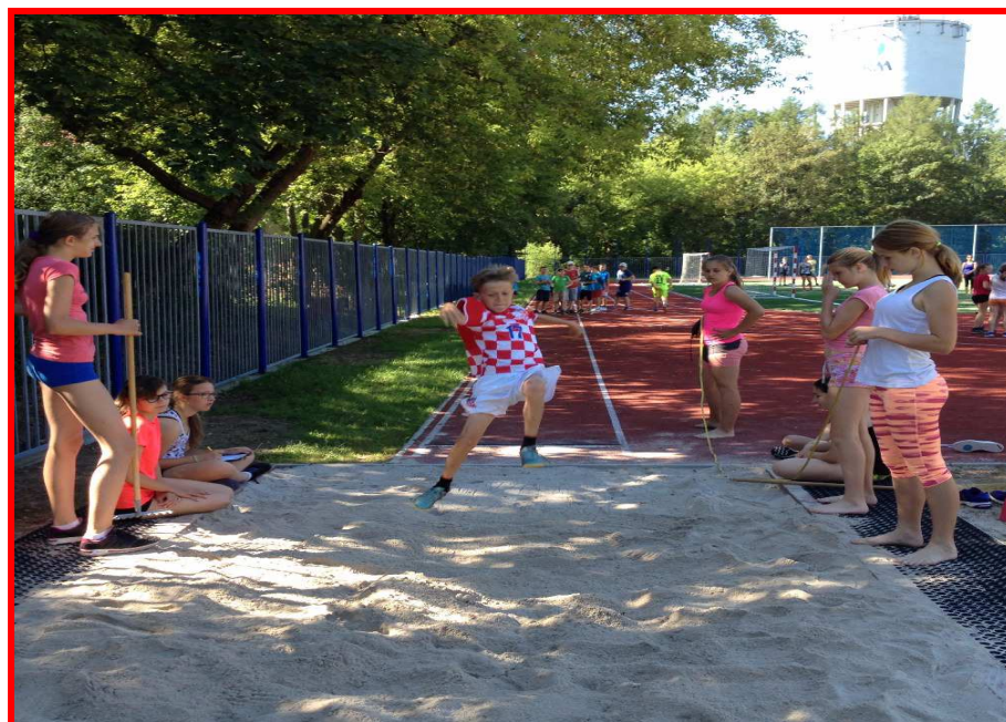
Na rekonstruovaném školním hřišti

Ve škole podporujeme všechny sporty. V tomto školním roce naši sportovci opět podali vynikající výsledky v kolektivních i individuálních sportech, a to na okresních, krajských i republikových soutěžích. Zúčastnili jsme se všech soutěží SLZŠ a ALZŠ