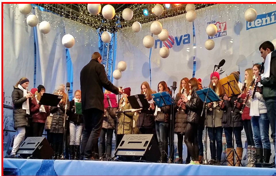
Flauti Vivace na Staroměstském náměstí

Při plnění úkolů, které plynou z hlavní činnosti školy - ze vzdělávání - spolupracuje škola i s jinými institucemi. Tradičně dobrá spolupráce je v hudební oblasti s 2. ZUŠ, která v budově školy provozuje odpoledne svou výuku. Touto spoluprací vycházíme vstříc rodičům, kteří nemusejí za výukou v hudební škole docházet. Společně jsme v letošním roce opět připravili Den hudby (viz. kapitola X. - sbory), vzájemně spolupracujeme i při zařizování učeben, které v odpoledních hodinách slouží jako učebny umělecké školy, potřebným technickým vybavením.