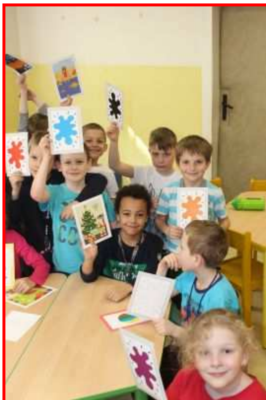
Angličtina ve školní družině

Základní škola je součástí výchovně vzdělávací soustavy, v právních vztazích vystupuje svým jménem a má odpovědnost vyplývající z těchto vztahů.