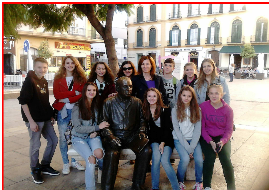
Jazykový pobyt ve španělské Málaze