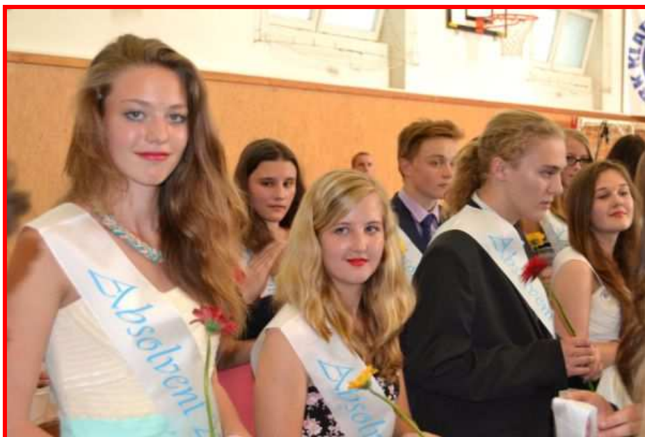
Vyřazení žáků devátých tříd