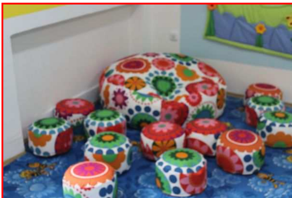
Relaxační sezení ve školní družině

Za velký úspěch považujeme rozšíření prostor ŠD o jedno oddělení. Po dlouhých letech se od září 2016 nebudou tísnit v jedné místnosti dvě oddělení ŠD.