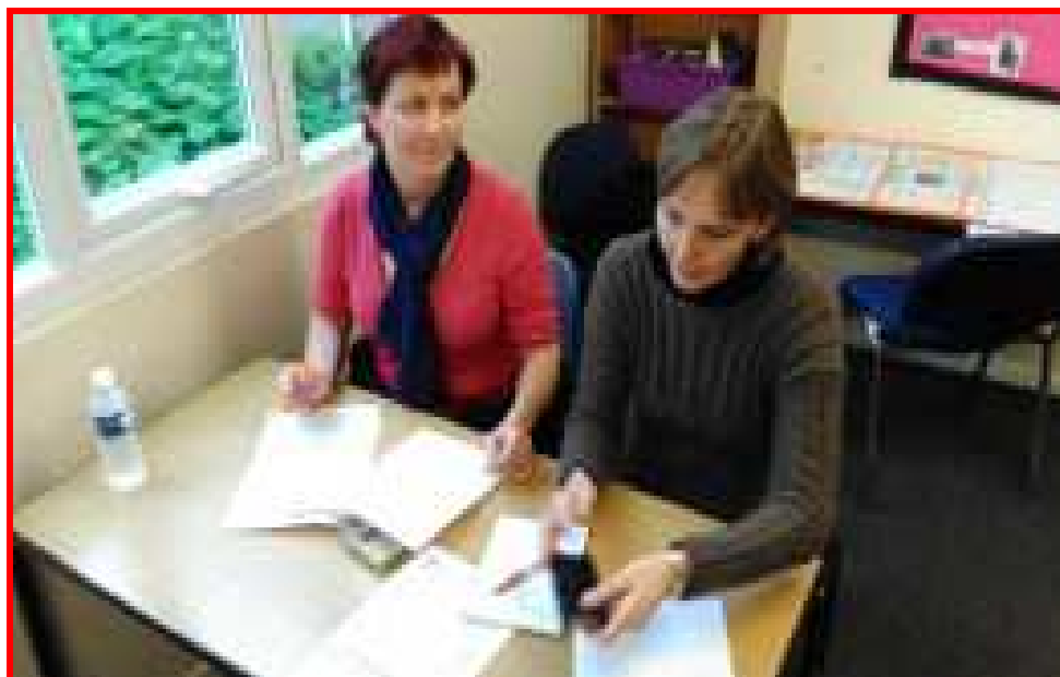
Stínování v anglické škole