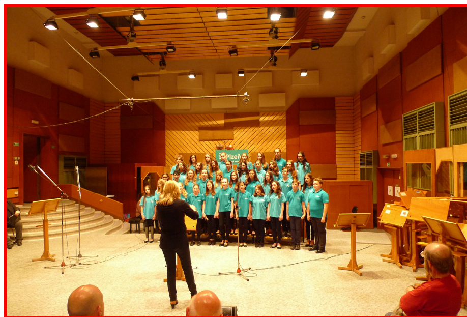
Pěvecký sbor Sluníčko v Plzeňském rozhlasu

Ve škole jsou otevírány třídy s rozšířenou výukou hudební výchovy, většina z jejich žáků je členem dětského pěveckého sboru Sluníčko, velká část pak také sboru zobcových fléten. Ve škole pracuje pět oddělení pěveckých sborů: Předškolní, Berušky: 1. ročník, Pidisluníčko: 2. - 3. ročník, Malé Sluníčko: 4. - 5. ročník, Sluníčko: 6. - 9. ročník a sbor fléten „Flauti Vivace”. Trpělivou prací našich sbormistrů se daří držet hudební kvalitu sborů na vysoké úrovni, sbory jsou zvány na různé akce, jiné sami organizují. Pravidelně také naši hudebníci vystupují na Vítání občánků v obřadní síni Magistrátu města Kladna, v letošním roce sbor Sluníčko zpíval při rozsvěcení vánočního stromu města Kladna.